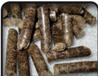
PELLETS de bogues de châtaignes