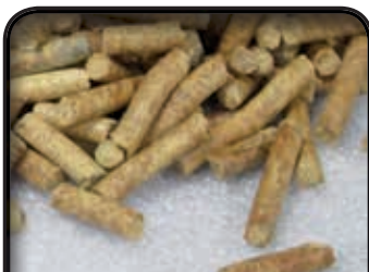
PELLETS de sapin rouge