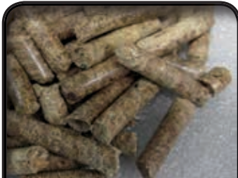
PELLETS de conifère